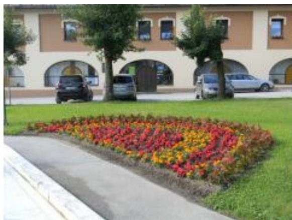
Slika: Nasad pred občinsko stavbo v Mežici

Skrbimo tudi za sajenje rastlin, ki jih rade obiskujejo čebele, na vseh javnih površinah v mestu.