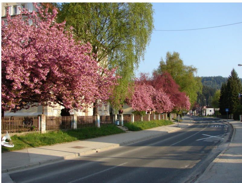
Nasad brez in japonskih češenj, ki so nam ga zapustile pretekle generacije