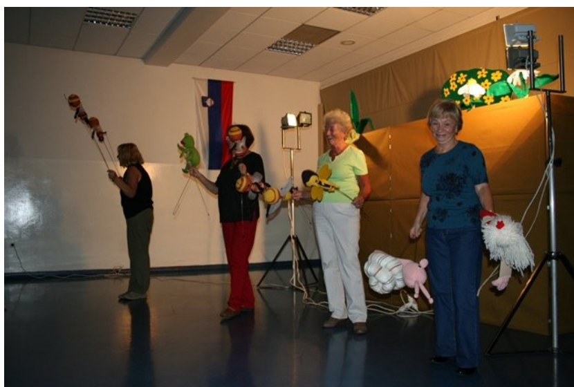
Sanje o čisti deželi, predstava na Prvi osnovni šoli Slovenj Gradec http://www.prva-os-sg.si/index.php/galerija/category/72-prvoolci