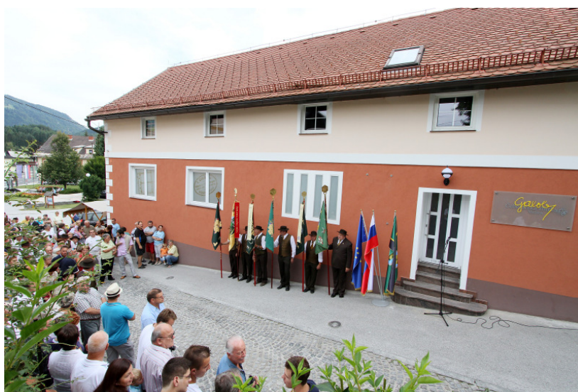
Otvoritev stalne razstave – postroj čebelarških praporov, 30.08.2012, Mežica

Čebelarška zbirka Mežica je zasnovana kot muzejska pripoved o zgodovini čebelarjenja v Zgornji Mežiški dolini z uporabo različnih vrst gradiv (predmetno, fotografsko, dokumentarno, filmsko), s poudarkom na lokalni kulturni dediščini.