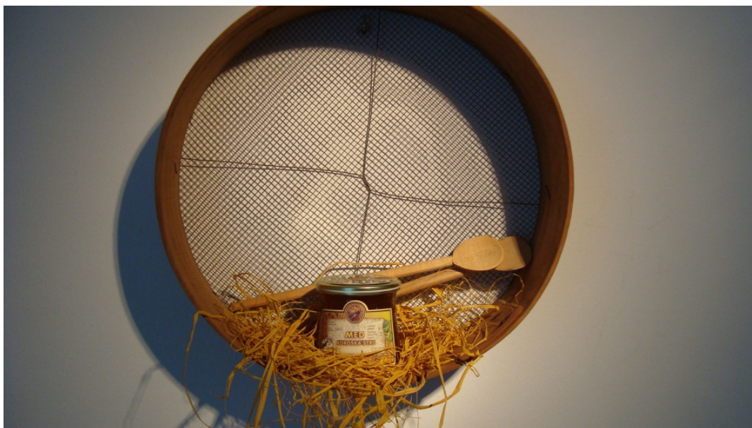
Koroški med

Protokolarna darila Občine Mežica vključujejo tudi med članov Čebelarske družine Mežica.