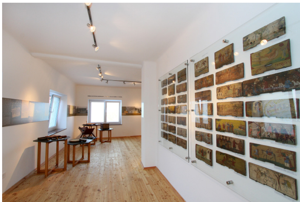
Čebelarstvena zbirka Mežica

Vse muzealije so za razstavo konservirali v restavratorski delavnici Koroškega pokrajinskega muzeja.