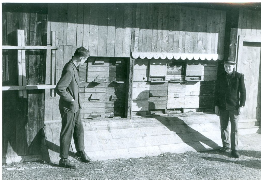
Na desni strani panji čebelarskega krožka v letu 1963

Mežica ima dolgo tradicijo organiziranja in poučevanja mladih čebelarjev. Prvi formalno ustanovljen tovrstni krožek je bil v okviru Čebelarskega odseka Pionirske zadruga leta 1960. Ohranjena je tudi dokumentacija za obdobje 1960/1967 (letni programi dela čebelarskega krožka, praktični pristopi pri delu s čebelami, zapisniki sestankov, korespondenca, promet,...).