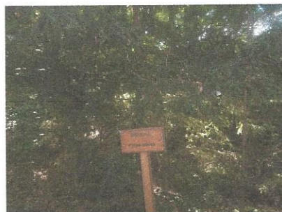
Smreka v Razkriškem kotu