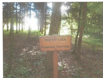
Trepetlika v Razkriškem kotu