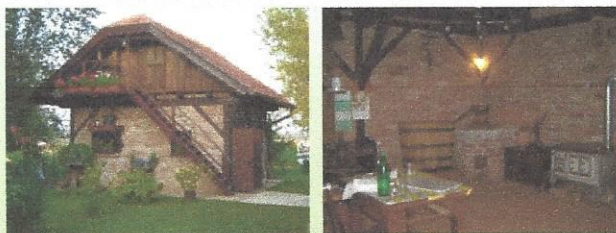
Žganjarski muzej Makovec

Pri Makovčevih na Šafarskem kuhajo žganje na starodobni način iz najrazličnejših vrst sadja. Možnost nakupa 20 različnih sort žganja. Specialiteta: degustacija žganja na domačem kruhu. (čas: 45 minut)