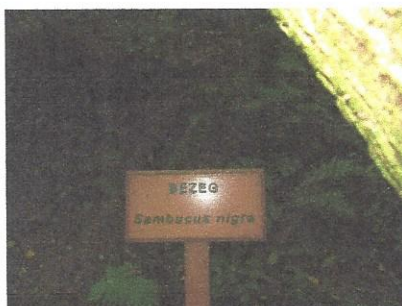
Bezeg v Razkriškem kotu