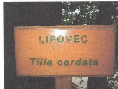
Lipovec v Razkriškem kotu