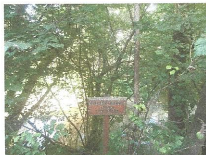
Poljski brest v Razkriškem kotu