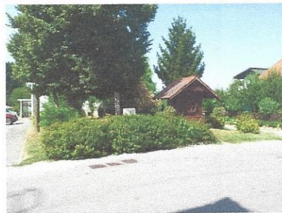
Lipovec in druga drevesa pred upravnimi prostori občine in kulturnim domom v Šafarskem

Tukaj raste tudi dve izjemni drevesi, in sicer približno 140 let stara Drobница ali Divja hruška, t.i. Drobница ob Večni poti, v naselju Gibina, ki v višino meri ocenjeno 25 m in ima ocenjeno 223 cm prsnega obsega, dokumentirano v brošuri Zavoda za gozdove Slovenije o Izjemnih drevesih Pomurja, ter drevo skorša (po domače »skoroša«).