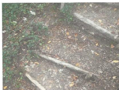
Navadni bršljan v Razkriškem kotu