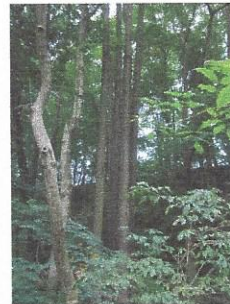
Visoki pajesen v Razkriškem kotu