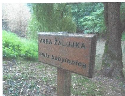
Vrba žalujka v Razkriškem kotu