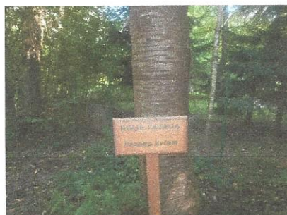
Divja češnja v Razkriškem kotu