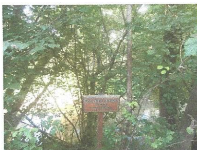
Črna murva v Razkriškem kotu