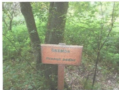
Čremsa v Razkriškem kotu