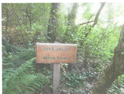
Siva jelša v Razkriškem kotu