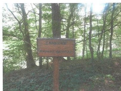
Črni trn v Razkriškem kotu