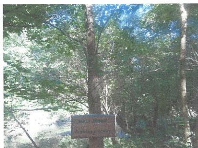
Mali jesen v Razkriškem kotu