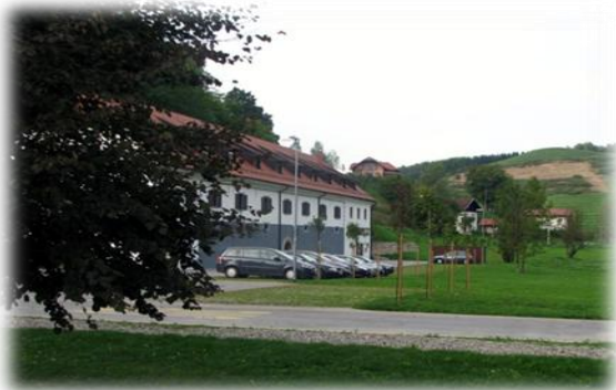
Posajene lipe in javorji pred občino