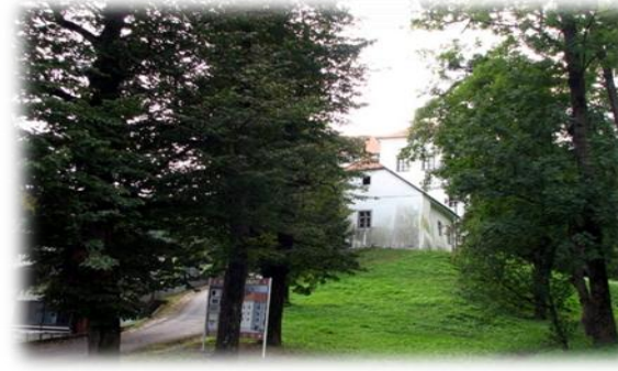
Lipe in akacija pri gradu Strmo