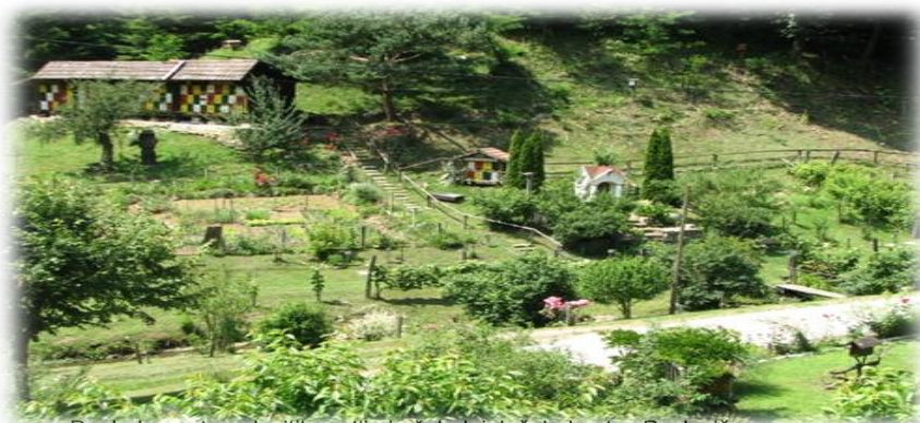
Pogled na vrt medovitih rastlin in čebelnjak čebelarstva Pavlovič