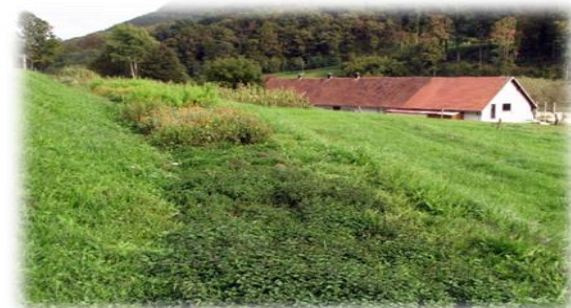
Nasad zelišč in dišavnic v Muzeju na prostem Rogatec