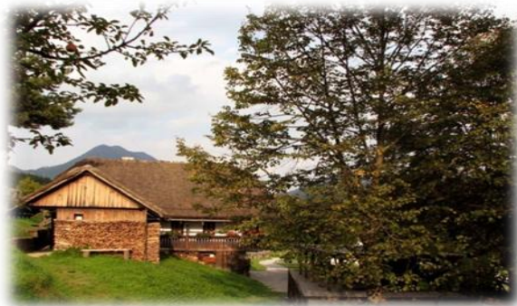
Lipe in sadno drevje v Muzeju