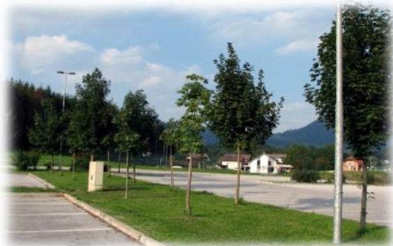
Lipe in divji kostanji pri OŠ