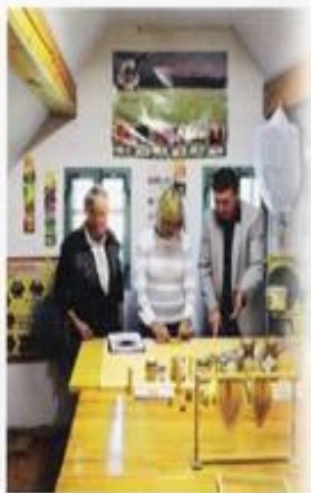
▲ V tej podstrešni sobici muzeja na prostem se odvijajo med mliadno zelo priljubljene delavnice za izdelovanje sveč in odličkov iz čebeljega voska.