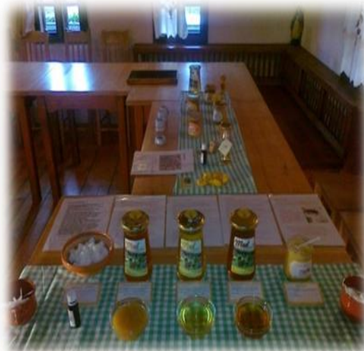
Čebelarska delavnica v Muzeju