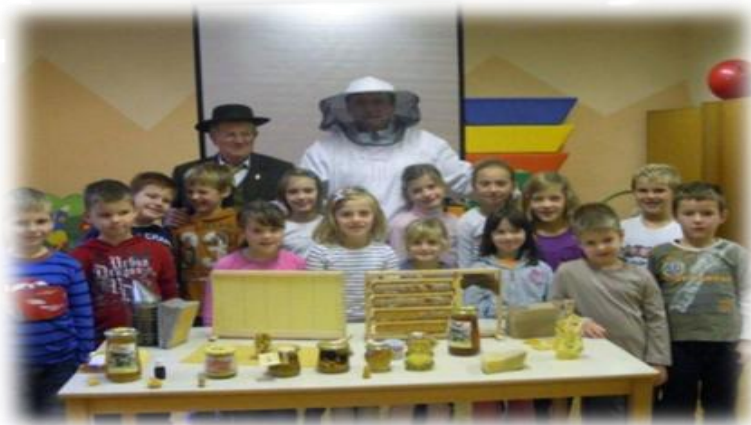
Obisk čebelarjev v OŠ