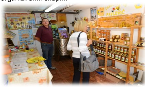
Trgovina čebelarstva Pavlovič