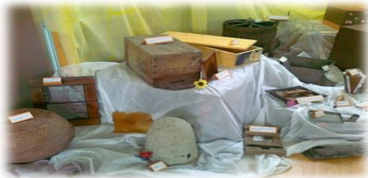
Prizor z ene izmed razstav

http://www.o-rogatec.ce.edus.si/dobovec/ostalo/zajtrk_cebelar/default.htm .