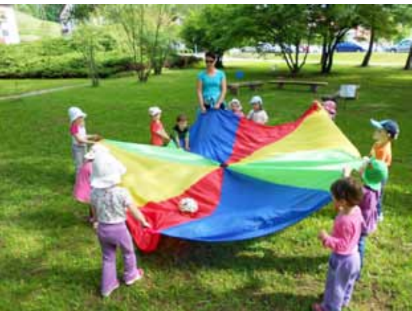
Razgibavanje s padalom, 2. oddelek

po zajtrku, med potjo so opazovali krave na paši. Otroci pri hoji niso imeli nobenih težav, uspešno so prišli na cilj, kjer so popili vodo in imeli dovolj energije za tek po travniku in igro v pesku. Našli so tudi zaklad – bombone, s katerimi so se posladkali.