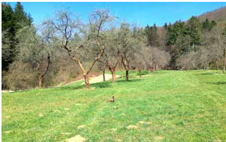
Sadovnjak je zacvetel

Občina Dobrna je lastnica sadovnjaka pri ribniku, s katerim je več let upravljal najemnik. Ker sadovnjak več let ni bil vzdrževan, drevesje ni bilo obrezano, bilo je preraščeno z bršljanom, se je občina odločila, da kot lastnica sadovnjaka prispeva k ohranitvi le-tega.