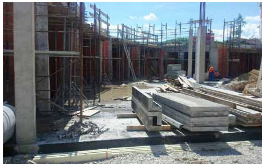
Napredovanje gradnje Vrtca Dobrna - pogled na igralnico

z zakonitostmi lokacije, na kateri se nahaja. Med slednje lahko štejemo oso(e)nčenost, naravne poteke poti skozi prostor, poglede, nivelacijo terena, vegetacijo ... in res je, ti parametri niso merljivi s številkami. So del kulture bivanja in zato bodimo do njih še toliko bolj pazljivi.