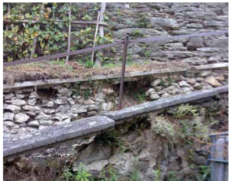
Razpadajoče obzidje, potrebno obnove

Skoraj vsi obiskovalci naše občine se ob prihodu v center Dobrne najprej zazrejo proti cerkvi Marijinega vnebovzetja. Ker okrušeno obzidje in razpadajoče stopnice, ki vodijo do cerkve, niso