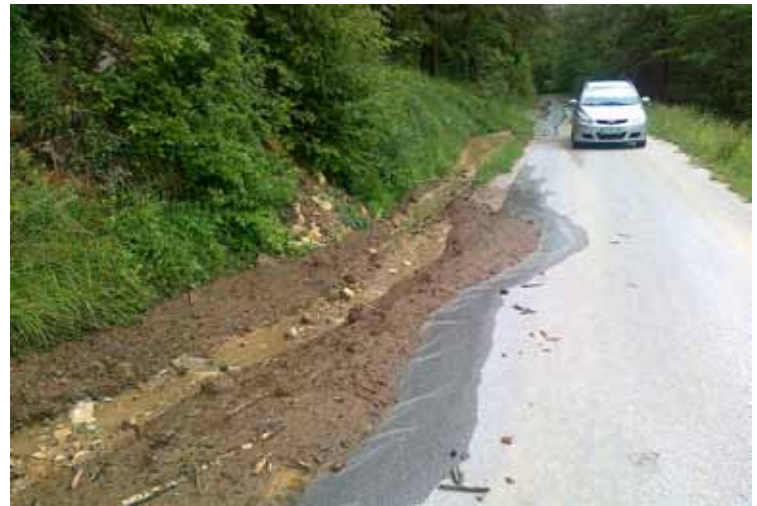
Nanos na cesti