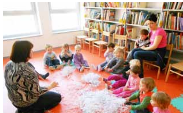
Knjižničarka pripoveduje zgodbo EKO KRALJ

Prav tako smo se izmenjali na urah pravljic v šolski knjižnici, kjer nam je knjižničarka