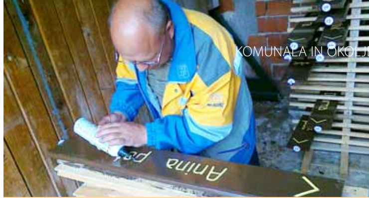
Barvanje napisov na tablah

Table mu je pred tem že pripravil režijski obrat, ki je nato narejene napise še ustrezno pobarval in table prebarval, da so pripravljene za postavitve. Tako smo v začetku aprila na novo