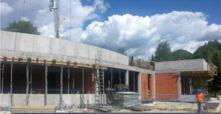
Napredovanje gradnje Vrtca Dobrna - pogled na upravni del