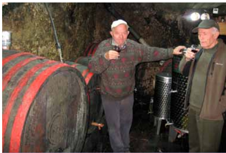
Iz vinograda smo se prestavili v klet in nazdravili

Ugodne vremenske razmere in topla jesen v lanskem letu so omogočile zdravo rast grozdja in bogato trgatav. MOŠT JE VINO POSTALO.