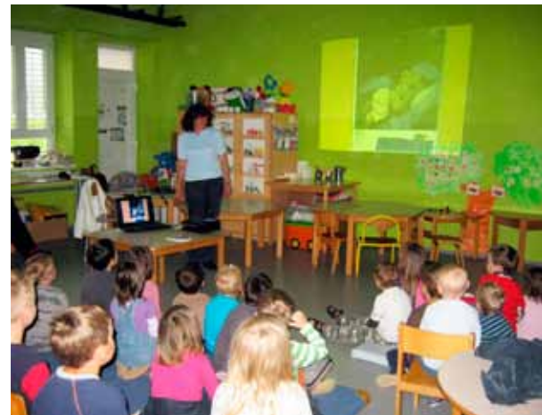
Obisk zobne sestree