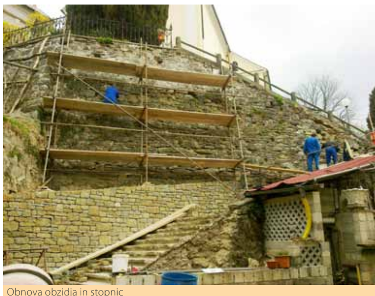
Obnova obzidja in stopnic

Na slikah je razvidno stanje obzidja pred pričetkom obnove in stanje obzidja sredi obnove. Ob tej priložnosti moram pohvaliti ekipo režijskega obrata, saj poteka obnova zelo kvalitetno in strokovno. Navedeno so izpostavili tudi predstavniki Zavoda za varstvo kulturne dediščine iz Celja.