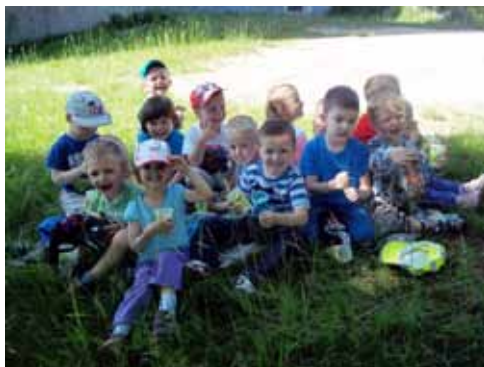
Pohod do cerkve sv. Miklavža

Najstarejši otroci so odšli na pohod v Do-