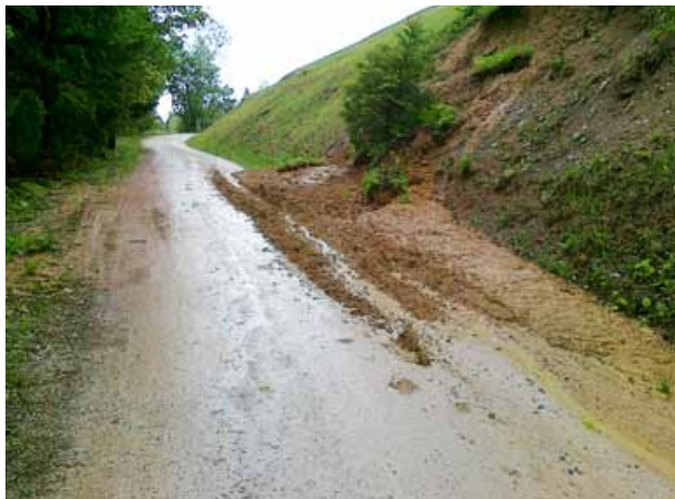
Usad na cesti

Občina Dobrna ima približno 72 km kategoriziranih cest, ki jih je potrebno vsako leto redno vzdrževati, še posebej zaradi vse pogostejših neurij in poplav, ki povzročajo škodo na cestni infrastrukturi.