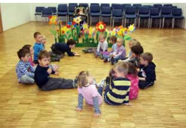
Vaje za nastop

Otroci 3. oddelka so sadili čebulice, tulipane, trobentice ter opazovali njihovo rast. Na obisk so povabili očete in dedke, ki so skupaj z otroki popoldne prišli v vrtec in izdelali darilo – rožico za mamicam, ki so jih na nastopu podarili mamicam. Nastale so zelo zanimive rožice, vsaka je bila nekaj posebnega. Očetje in dedki so se zelo izkazali in pokazali, da imajo veliko ustvarjalne žilice ter ročnih spretnosti.