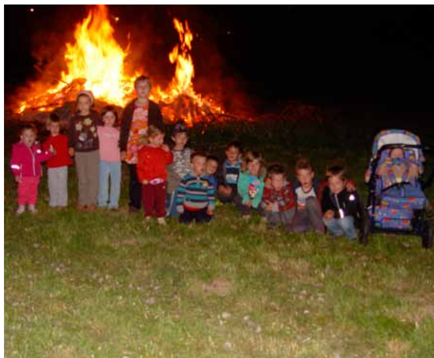
Nocoj ni noč za spanje, so rekli mladi in tako pozirali fotografom

Kakor koli že, rekli smo, da se ob kresu drugo leto spet dobimo.