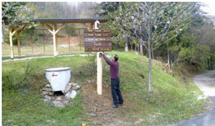
Montiranje tabel na terenu

označili naselja Parož, Brdce nad Dobrno in Strmec nad Dobrno. Delo smo nadaljevali še v delu naselij Lokovina, Loka pri Dobrni, Klanc in delu Dobrne. Postavitve se v teh dneh izvajajo še v Zavrhu nad Dobrno in Vrbi. Vsekakor v prihodnosti načrtujemo označitev še dopolniti, vendar projekt predstavlja velik finančni zalogaj in ga bomo poskušali financirati preko razpisov. Upamo, da bo nova podoba služila svojemu namenu in bo med obiskovalci našega kraja dobro sprejeta.