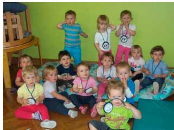
Medalje - poligon

Otroci 3. oddelka so odšli na pohod do cerkve sv. Miklavža. Odpravili so se takoj