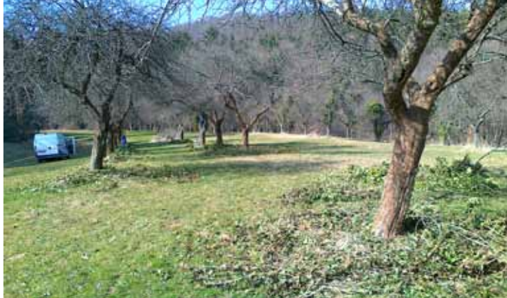
Čiščenje in obrezovanje dreves v sadovnjaku